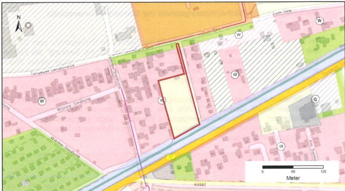
Abb. 2: Auszug aus dem FNP der Gemeinde Doberschütz vom 22.07.2005 (Stand: 12/2020)