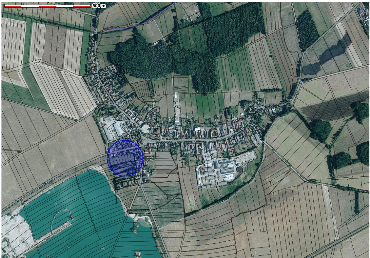
Übersichtsplan OT Sprotta mit Standort Wohnbaugebiet