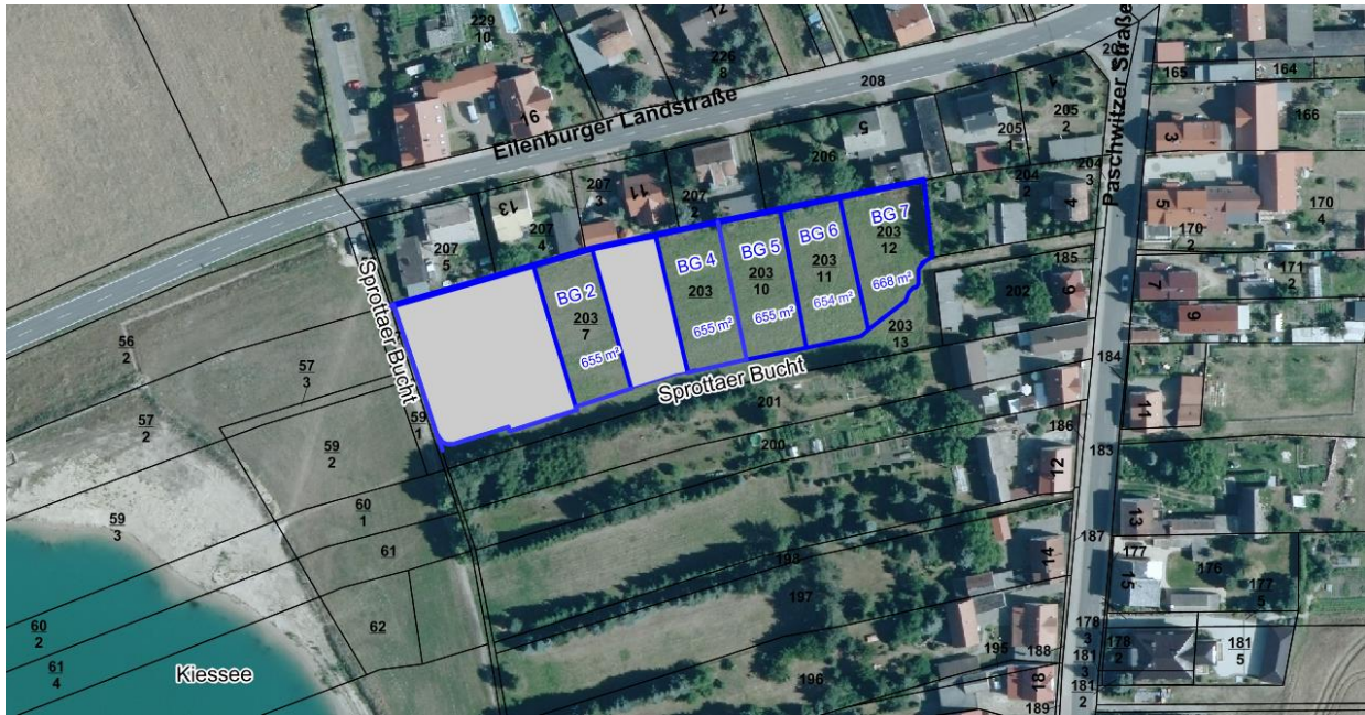
Lageplan der Baugrundstücke (BG)