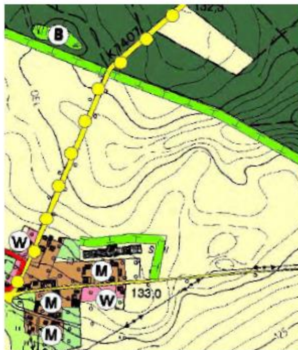
Flächennutzungsplan Gemeinde Doberschütz Genehmigter Stand