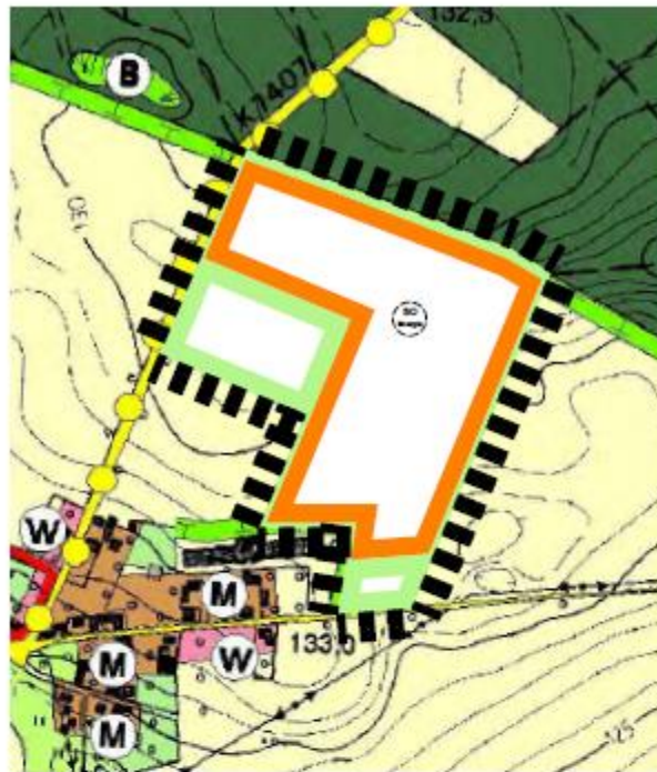
Flächennutzungsplan Gemeinde Doberschütz 5. Änderung - Vorentwurf