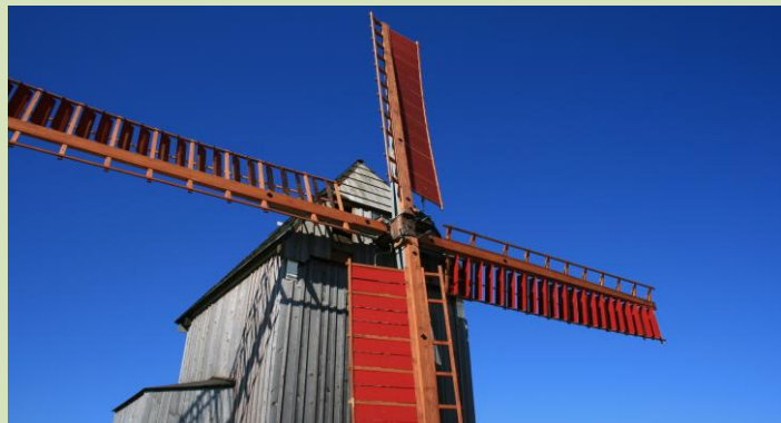
Werbeliner Bockwindmühle im Schullandheim Reibitz