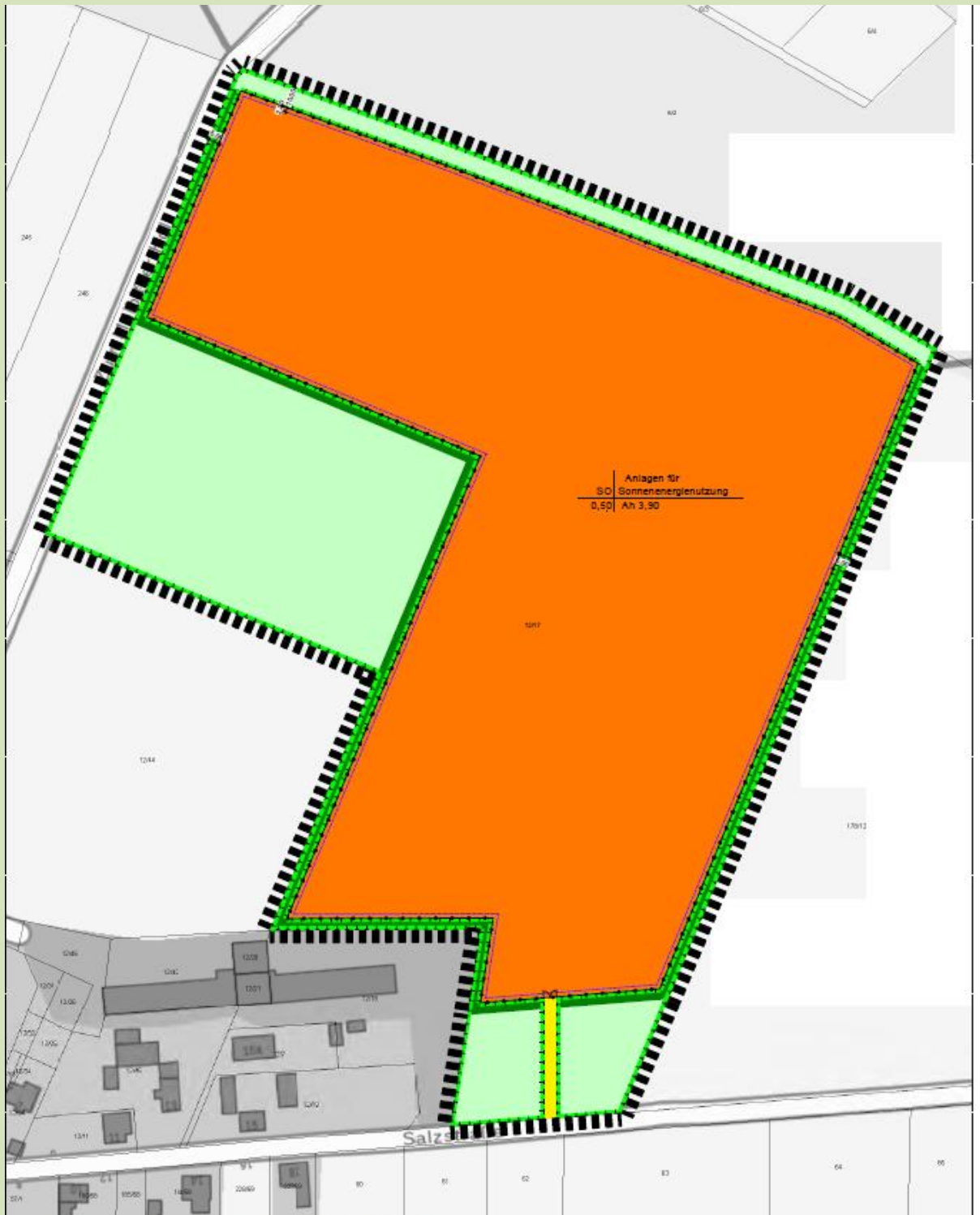
Lageplanausschnitt Solarpark (Flur Nr. 12/17, Gemarkung: Mölbitz, Flur 1)