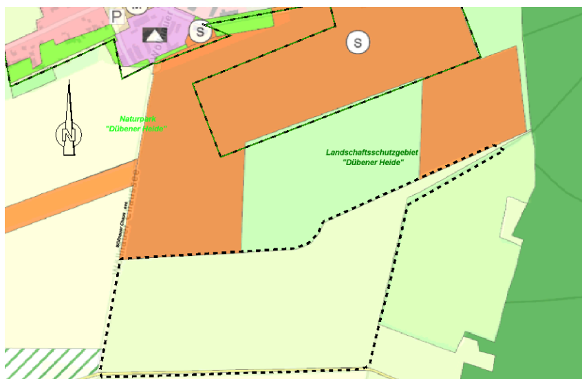
Ausschnitt rechtskräftiger Flächennutzungsplan

Für die Gemeinde Doberschütz liegt ein wirksamer Flächennutzungsplan vor. Dieser wird in einem parallelen Verfahren durch die 6. Änderung fortgeschrieben.